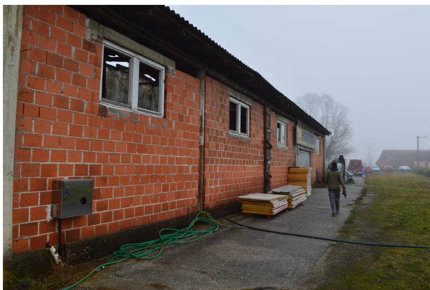
Fotografija 3 : Pogled na trošnu zgradu Pilana na k.č. 52/6 (južno pročelje)