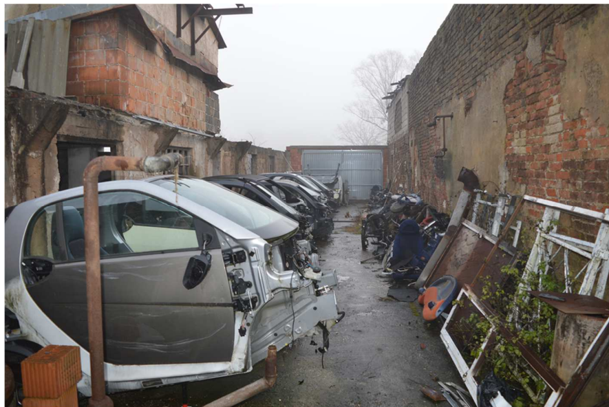
Fotografija 7 : Unutrašnjost zgrade na k.č. 52/6 (nenetkriveni dio)