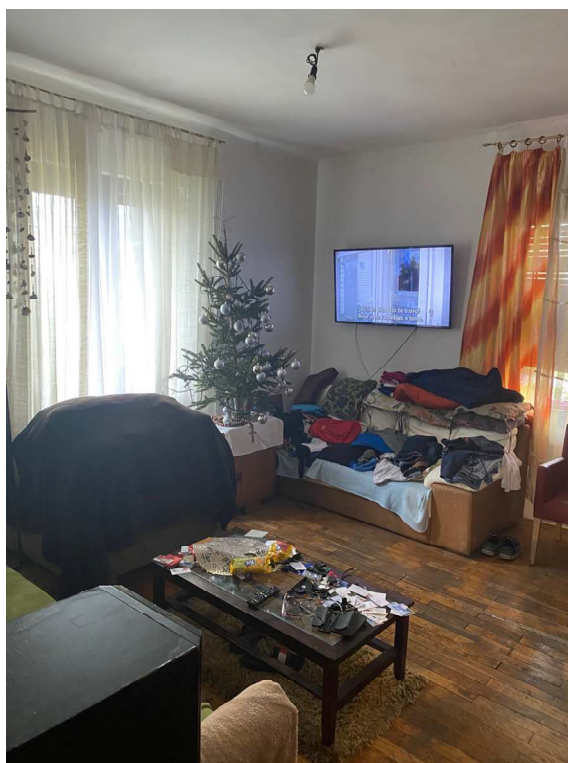
Fotografija 22 Kuća (u dijelu) izgrađena na k.č. 52/6 i 52/2 (nije predmet procjene) Unutrašnjost