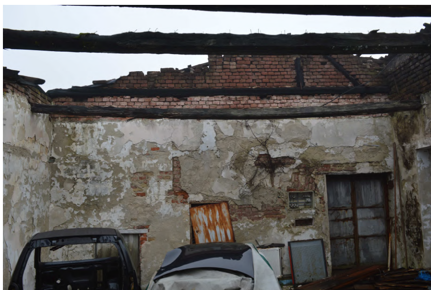
Fotografija 16 : Unutrašnjost zgrade na k.č. 52/6