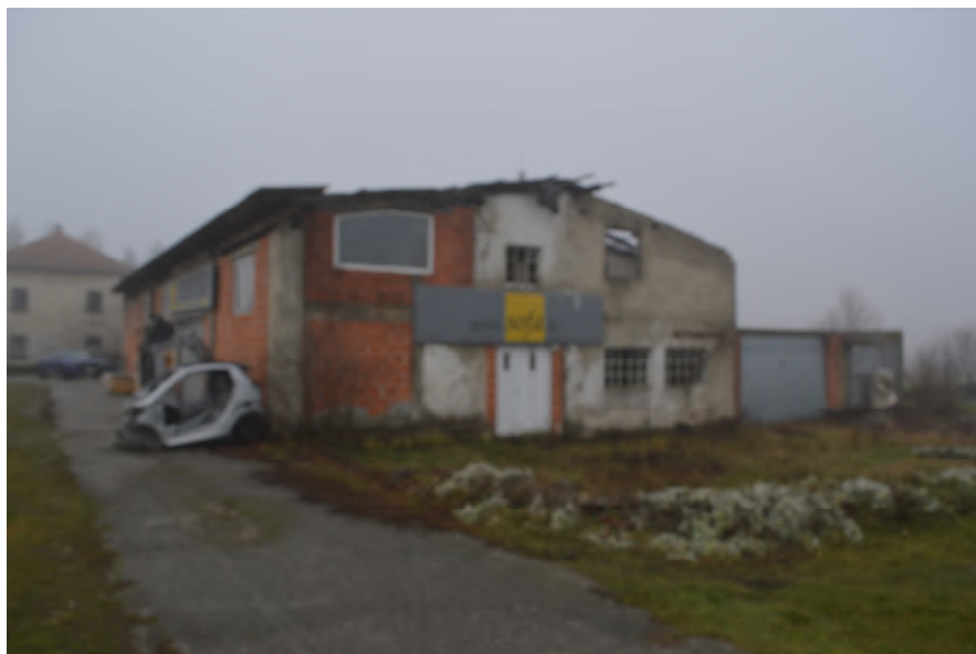
Fotografija 2 : Pogled na trošnu zgradu Pilana na k.č. 52/6 (istočno pročelje)