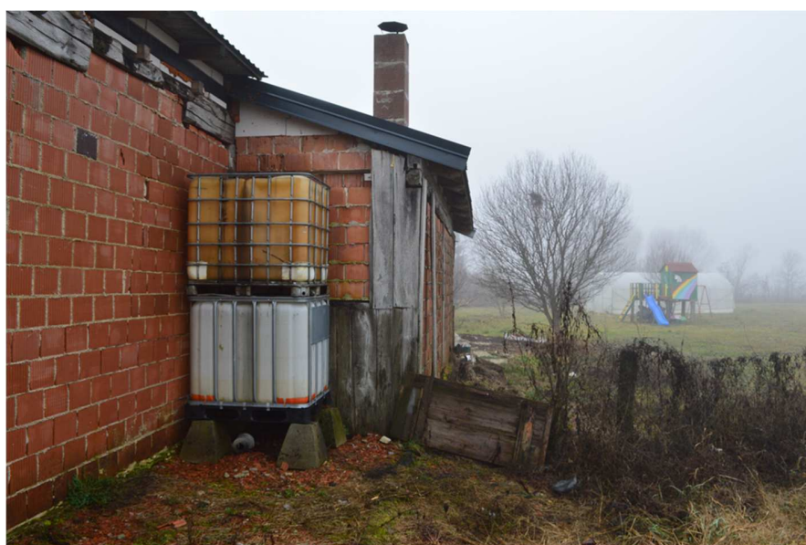
Fotografija 6 : Pogled na trošnu zgradu na k.č. 52/6 (sjeverno pročelje)