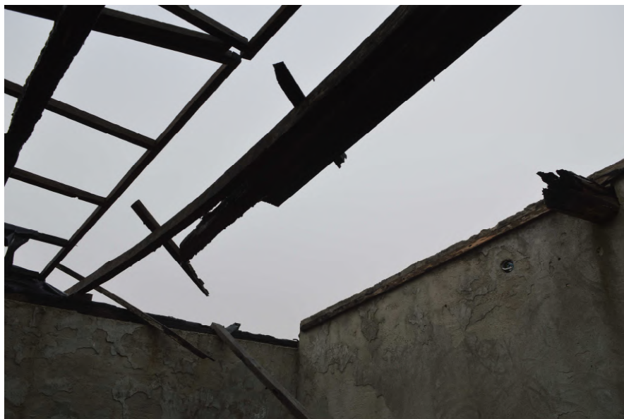
Fotografija 17 : Ostaci krova zgrade na k.č. 52/6