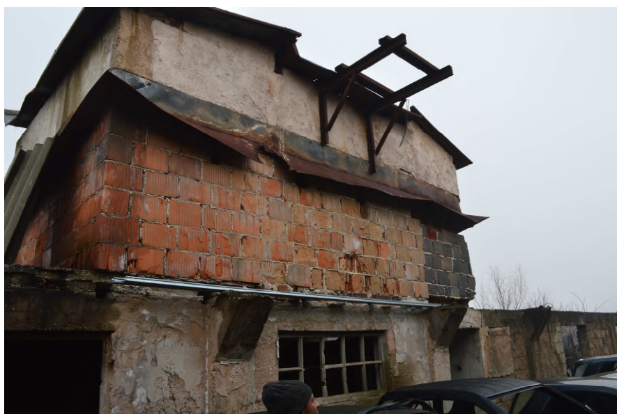
Fotografija 14 : Zgrada na k.č. 52/6