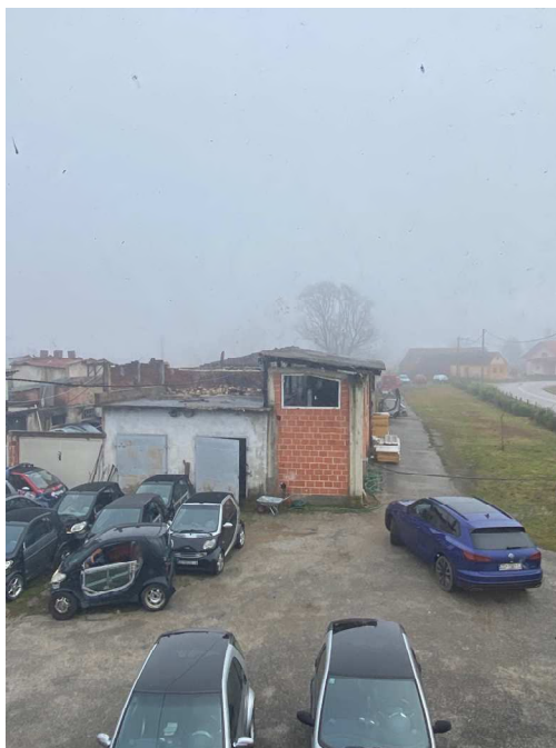
Fotografija 1 : Pogled na trošnu zgradu Pilana na k.č. 52/6