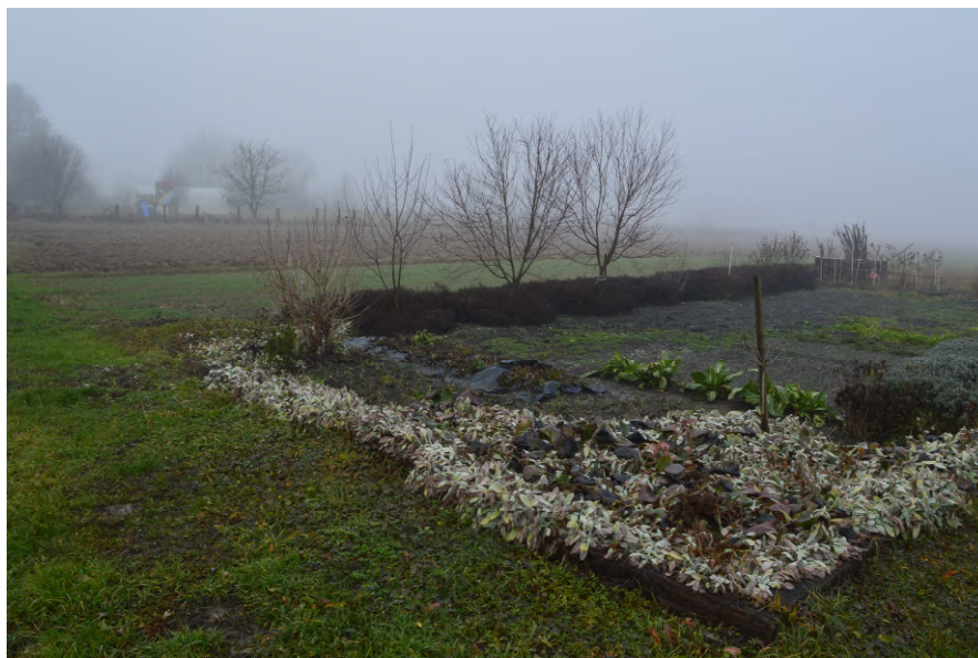
Fotografija 10 : Pogled na oranicu k.č. 52/1