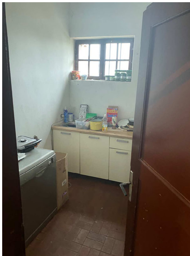
Fotografija 16 Kuća (u dijelu) izgrađena na k.č. 52/6 i 52/2 (nije predmet procjene) Unutrašnjost