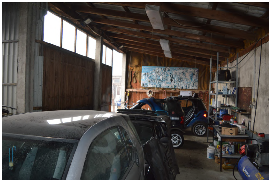
Fotografija 8 : Unutrašnjost zgrade na k.č. 52/6 (natkriveni dio)