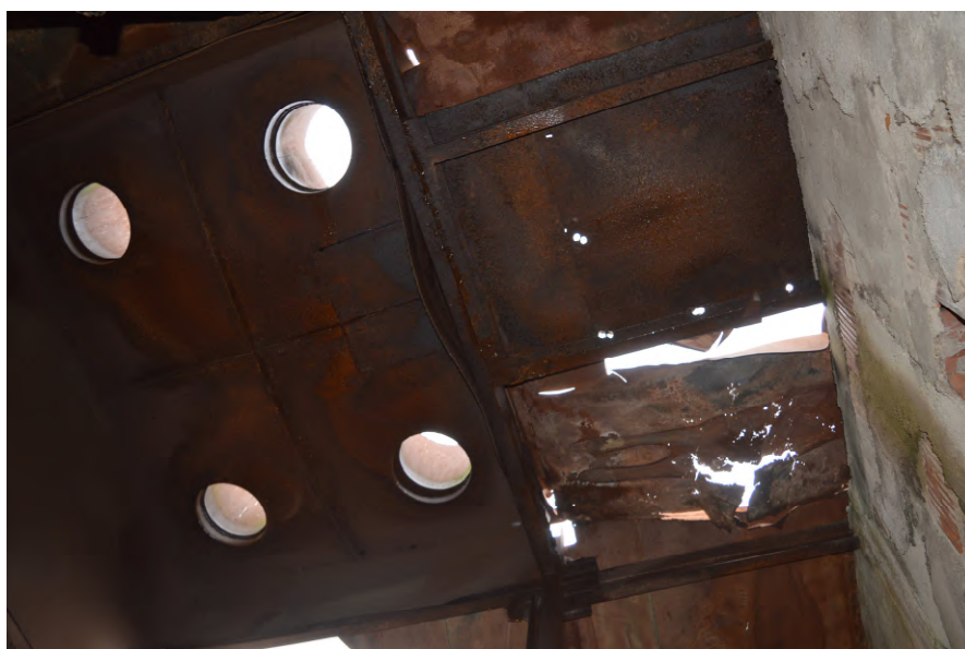
Fotografija 12 : Unutrašnjost zgrade na k.č. 52/6 (nenatrkiveno)