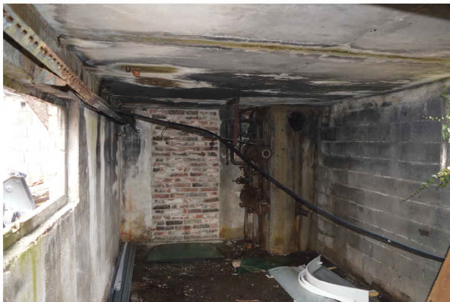
Fotografija 13 : Unutrašnjost zgrade na k.č. 52/6