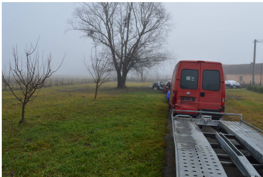
Fotografija 3 : Pogled na oranicu na k.č. 52/8 koja se koristi kao pristup i parking