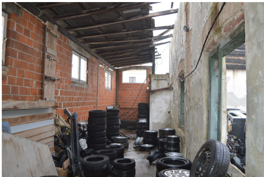
Fotografija 15. Unutrašnjost zgrade na k.č. 52/6