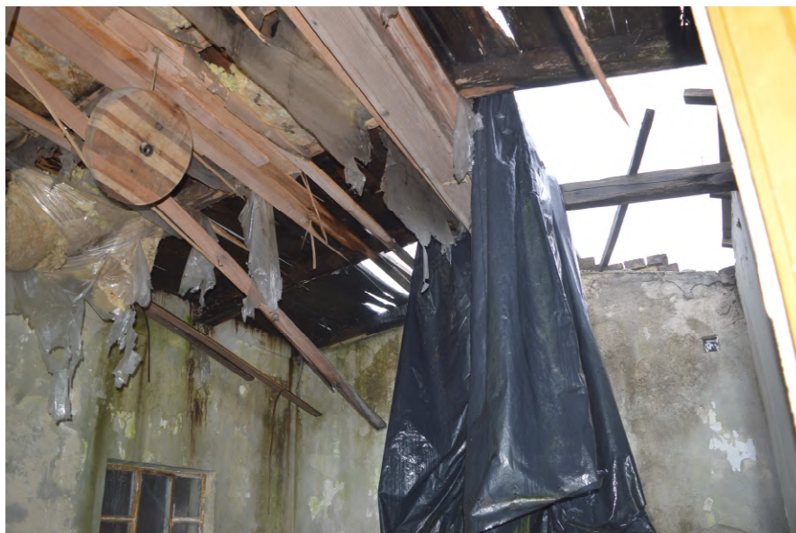
Fotografija 18: Ostaci krova zgrade na k.č. 52/6