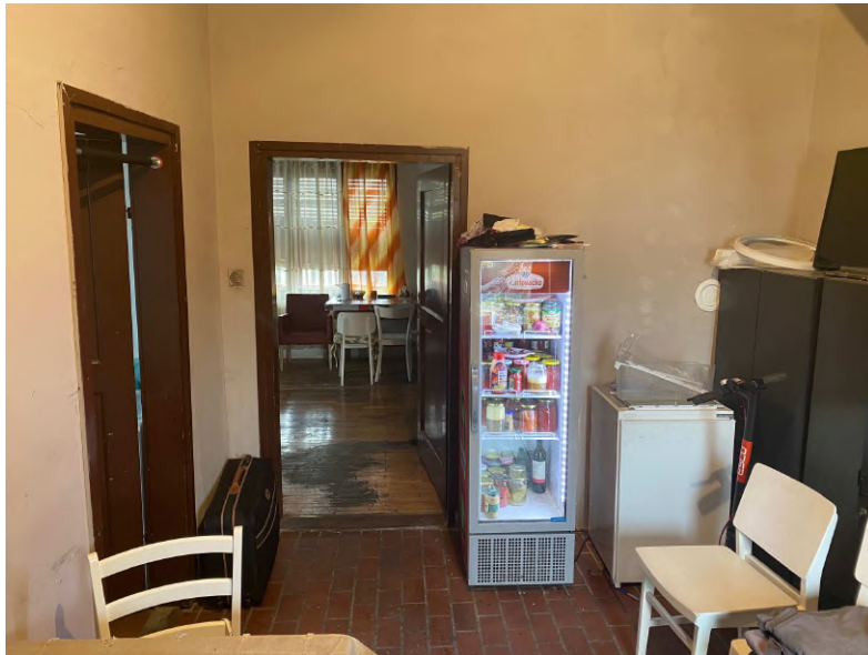
Fotografija 23 Kuća (u dijelu) izgrađena na k.č. 52/6 i 52/2 (nije predmet procjene) Unutrašnjost