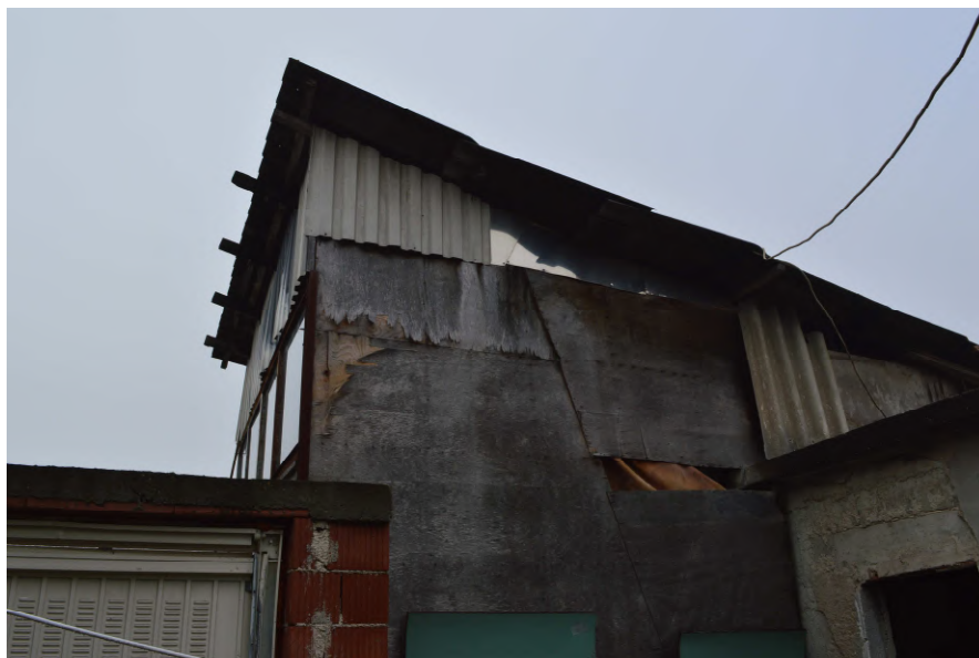
Fotografija 19 : Unutranji objekti zgrade na k.č. 52/6