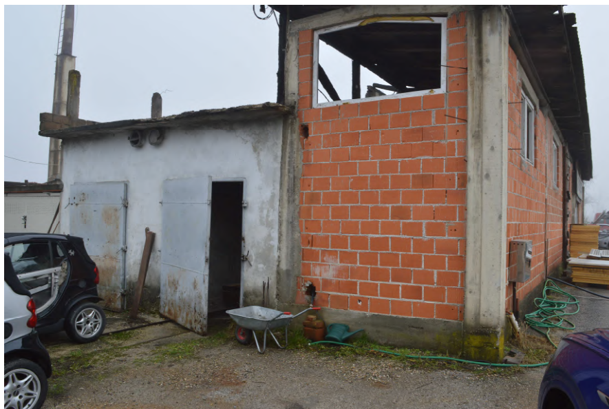
Fotografija 2 : Pogled na trošnu zgradu Pilana na k.č. 52/6 (zapadno pročelje)