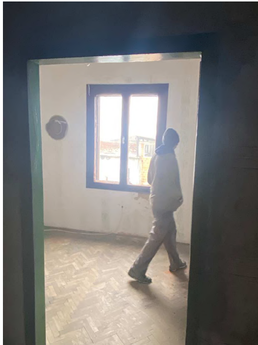
Fotografija 21 Kuća (u dijelu) izgrađena na k.č. 52/6 i 52/2 (nije predmet procjene) Unutrašnjost