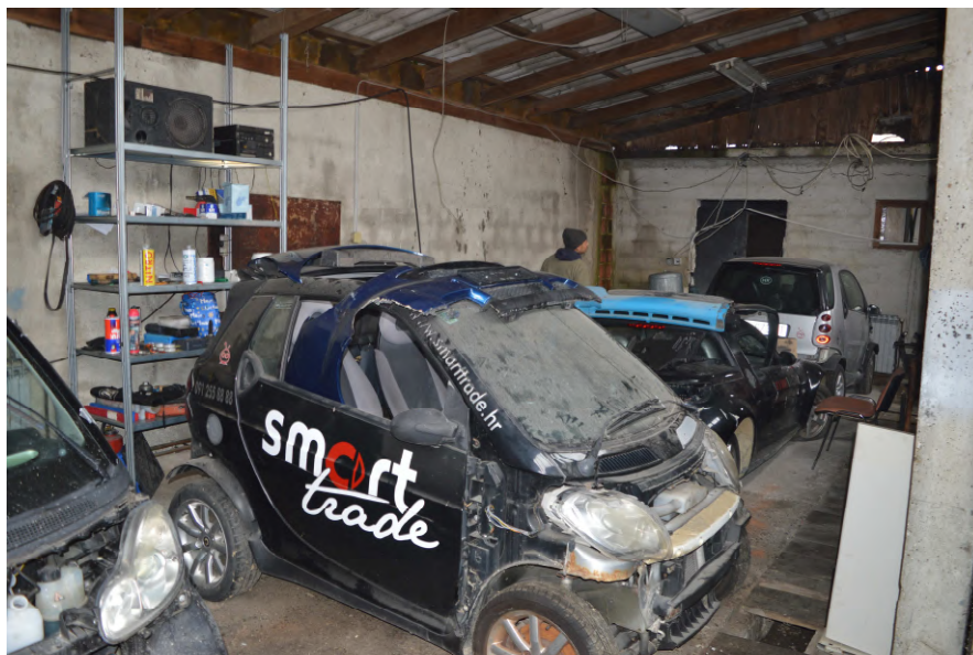
Fotografija 9 : Unutrašnjost zgrade na k.č. 52/6 (natkriveni dio)