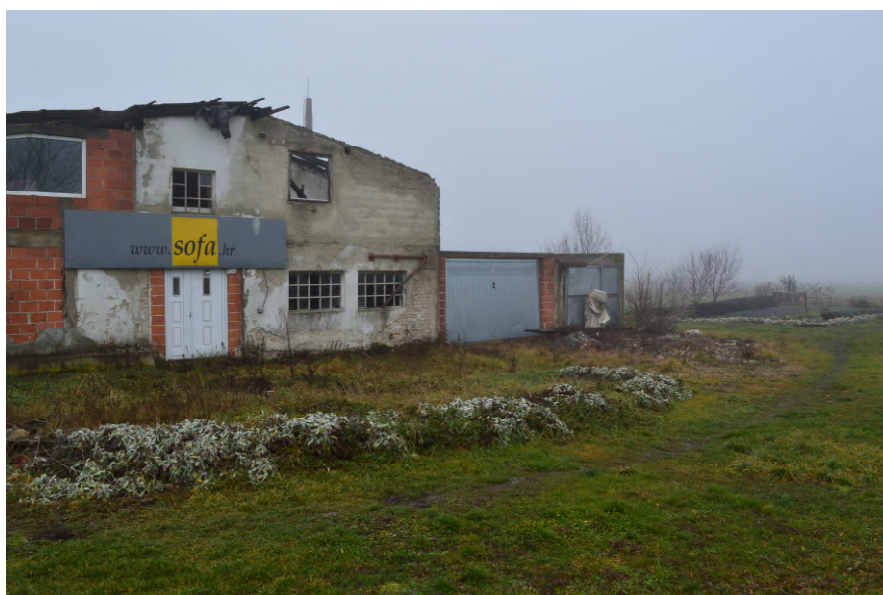
Fotografija 4 : Pogled na trošnu zgradu na k.č. 52/6 (istočno pročelje)