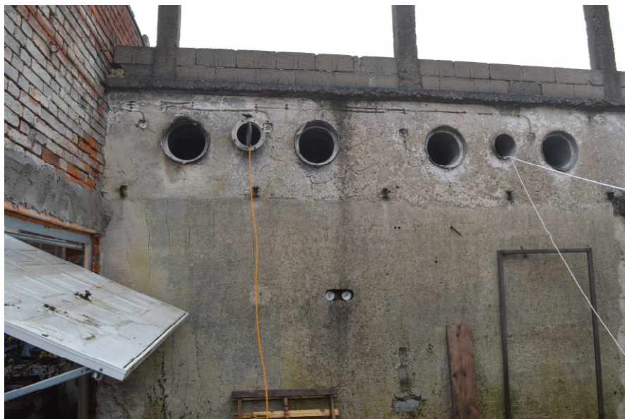
Fotografija 11 : Unutrašnjost zgrade na k.č. 52/6 (nenatrkiveno)