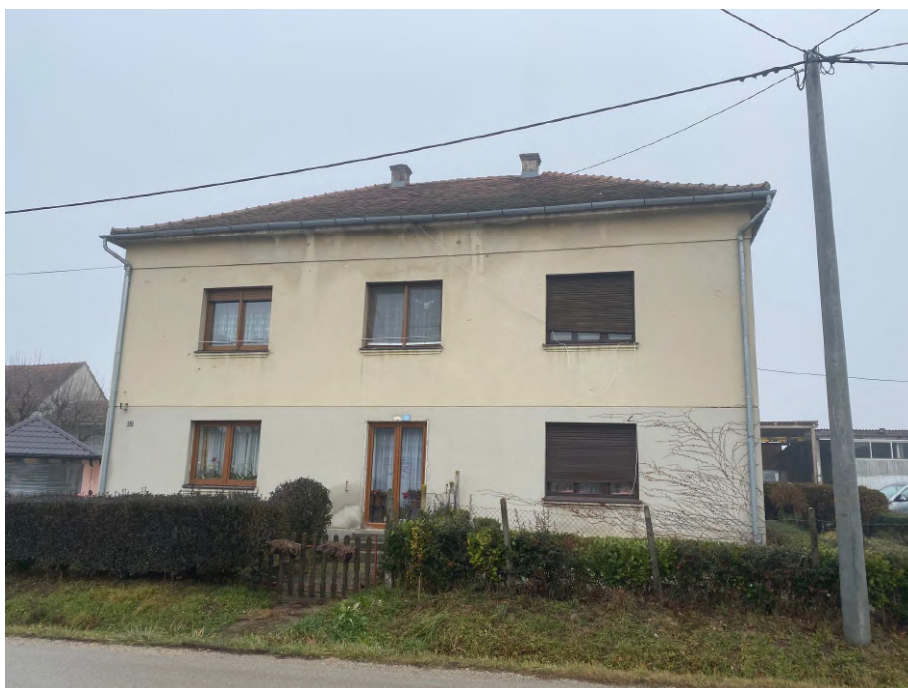
Fotografija 20 Kuća (u dijelu) izgrađena na k.č. 52/6 i 52/2 (nije predmet procjene)