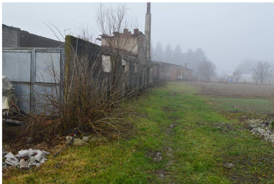
Fotografija 5 : Pogled na trošnu zgradu na k.č. 52/6 (sjeverno pročelje)